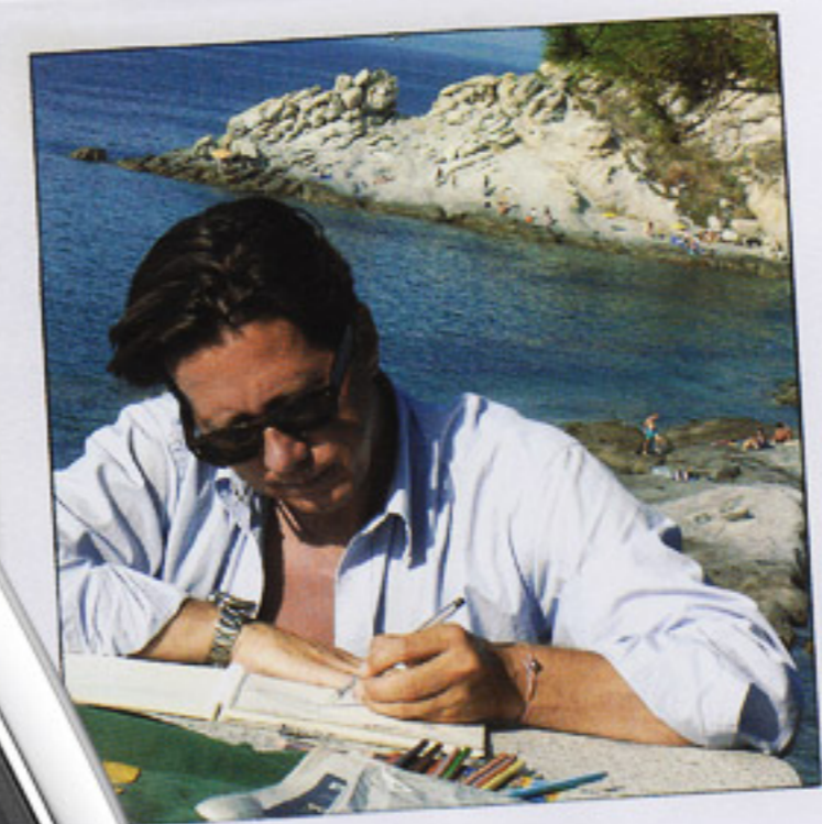
8 e m HW - Opus 9