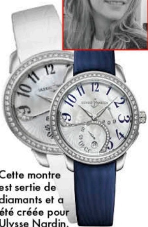
Cette montre est sertie de diamants et a été créée pour Ulysse Nardin.