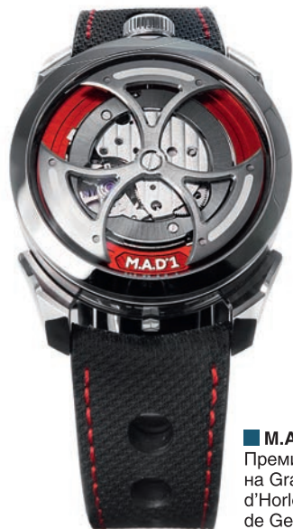
■ M.A.D.1 Red. Премия Challenge на Grand Prix d'Horlogerie de Geneve 2022

я как хамелеон, действую в зависимости от марок, от моделей. «авторский стиль» мне кажется скучным