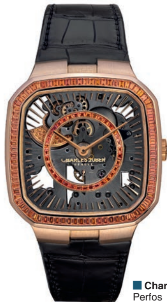
■ Charles Zuber Perfos